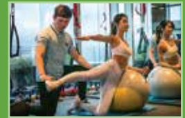
1:1 PT ROOM