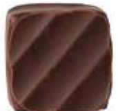
라즈베리 감미로운 라즈베리 과즙에 다크 초코렛이 더해져 달콤 쌉싸름한 맛이 절묘하게 대비 이루는 라즈베리 초콜릿