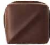
오렌지 캔디드 오렌지 필에 프랑스산 코인트로 리큐어의 풍부한 향이 레이어드된 오렌지 초콜릿