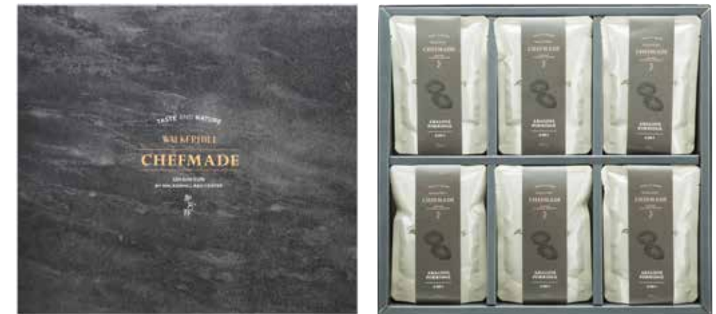
御珍鮮, 활 전복 죽 260 g x 6入

예로부터 진상품으로 궁중 연회식에 오르던 전복은 원기를 돋우는 보양식으로 귀히 여겨져 왔습니다. 오랜 시간 한식의 전통을 이어온 워커히л 명장의 자부심을 담아 선보이는 어진선(御珍鮮) 활 전복죽은 청정 해역 완도산 활 전복과 高 영양의 내장을 오랜 정성으로 완성하여 우리 식문화의 가치와 품격을 고스란히 담았습니다.