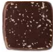
약콩 국산 약콩(쥐눈이콩)의 풍부한 영양성분을 담아낸 약콩 초콜릿