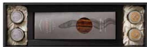
모에기 양념장어 5미

일식당 모에기만의 요비모도시 기법으로 완성한 특유의 깊은 감칠맛을 느껴보시기 바랍니다. 워커히ل 옛 일식당인 세키테이 (석정) 때부터 35년간 맥을 이어 제조해온 특제 소스와 두 번의 정선을 비롯해 찌기, 굽기 등 총 8차례의 조리과정을 거쳐 만든 장어구이의 담백한 맛을 경험해 보시기 바랍니다.