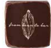
다크 카카오 고유의 짙달하고 진한 풍미를 살린 다크 초콜릿