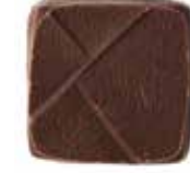
헤이즐넛 최상급 헤이즐넛 프랄린에 프랑스산 생크림이 더해진 헤이즐넛 초콜릿