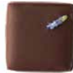
라벤더 식용 라벤더 꽃잎이 토핑되어 은은하고 향기로운 여운을 더하는 라벤더 초콜릿