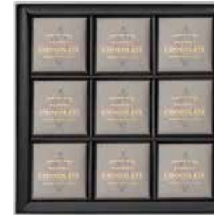
워커힐 빈투바 초콜릿

無 설탕 빈투바 (Bean-to-Bar) 초콜릿 가공법으로 카카오 고유의 맛과 향을 느낄 수 있으며 영양은 살리고, 혈당·칼로리 걱정을 낮추었습니다. 최상급 그랑 크뤼 (Grand Cru) 카카오 60% 다크 초콜릿에 생리활성 물질이 풍부한 국산 약콩 (쥐눈이콩)을 통째로 갈아 넣어 건강까지 생각한 순 식물성 초콜릿입니다. *초콜릿 1개에 5알의 국산 약콩 함유