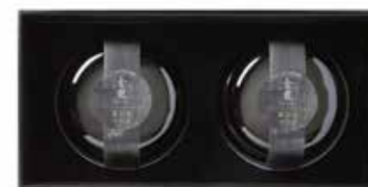
불도장 280g X 2인

불도장은 그 맛과 향에 홀린 스님이 참선을 하다 담을 넘었다는 데서 유래된 이름입니다. 불도장은 해삼, 전복, 상어 지느러미 등 진귀한 식재료가 들어가는 대표적인 중국의 보양식으로, 금룡에서는 8시간 이상 푹 끓인 육수에 진귀한 재료들을 넣고 약한 불에서 4~5시간 정도 달인 후 완성됩니다. 원기를 회복하는데 좋은 음식인 불도장은 최고의 약선 중 하나입니다.