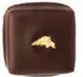
패션프루트 풍부한 향기의 열대과일 패션프루트에 최상급 카카오 버터의 깊고 부드러운 풍미가 더해진 패션프루트 초콜릿