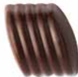
바나나 부드럽고 진한 바나나의 풍미가 입안 가득 터지는 바나나 초콜릿