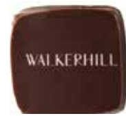
바닐라 최상급 바닐라 빈과 카카오의 풍미가 부드럽게 조화를 이루는 바닐라 초콜릿

카카오의 깊고 진한 풍미가 가나슈의 부드러운 텍스처와 최상의 밸런스를 이루는 워커힐 시그니처 초콜릿은 오감으로 경험할 수 있는 감동의 순간을 선사합니다.