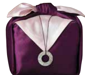
온달 명품 간장 게장 3 kg

일반 간장 게장과 달리 양념이 깊이 배도록 긴 숙성 기간을 거쳐 만든 온달 명품 간장 게장은 담백한 맛뿐만 아니라 지방이 적고 단백질이 많아서 영양소의 소화 흡수가 원활합니다. 로이신, 아르기니 등 필수 아미노산이 풍부하게 들어 있어 노약자뿐 아니라 성장기 어린이에게도 효과적인 건강식품입니다.