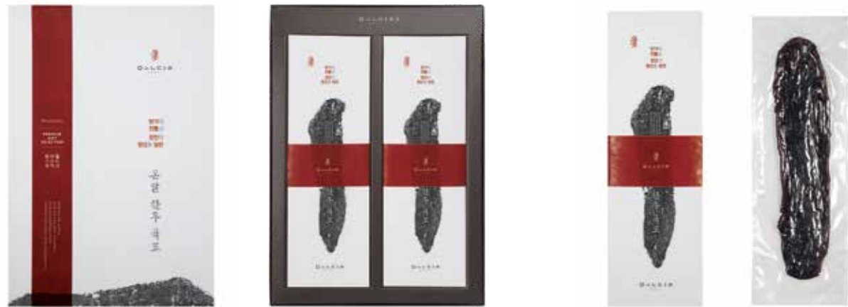
한우 육포 600g

육포는 삼국사기의 신라본기 신문왕 3년의 폐백 품목에서 처음 나타난 기록이 있습니다. 소고기 자체가 귀한 데다가 고기 손질과 건조에 오랜 시간이 걸리는 만큼 상류층에서 귀한 손님에게만 대접했던 음식이라고 전해집니다. 한우 육포에는 장인의 고집스러운 정성이 담겨있습니다. 최고급 한우 흉두께살을 엄선하여 천연 양념에 재우고 말리는 과정을 거쳐 만들어집니다. 드시는 분의 건강을 생각하여 어떠한 인공 첨가물도 사용하지 않아 한우 고유의 깊고 담백한 풍미가 두툽한 육질을 씹을수록 은은하게 배어 나오며, 전통 육포 고유의 자연스러운 빛을 지니고 있습니다.